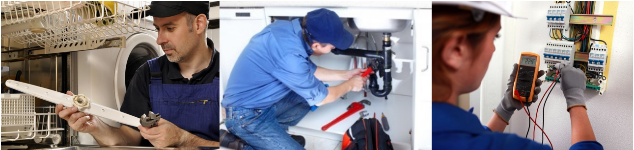
Imagem3- Profissionais de várias áreas com serviço 24 horas