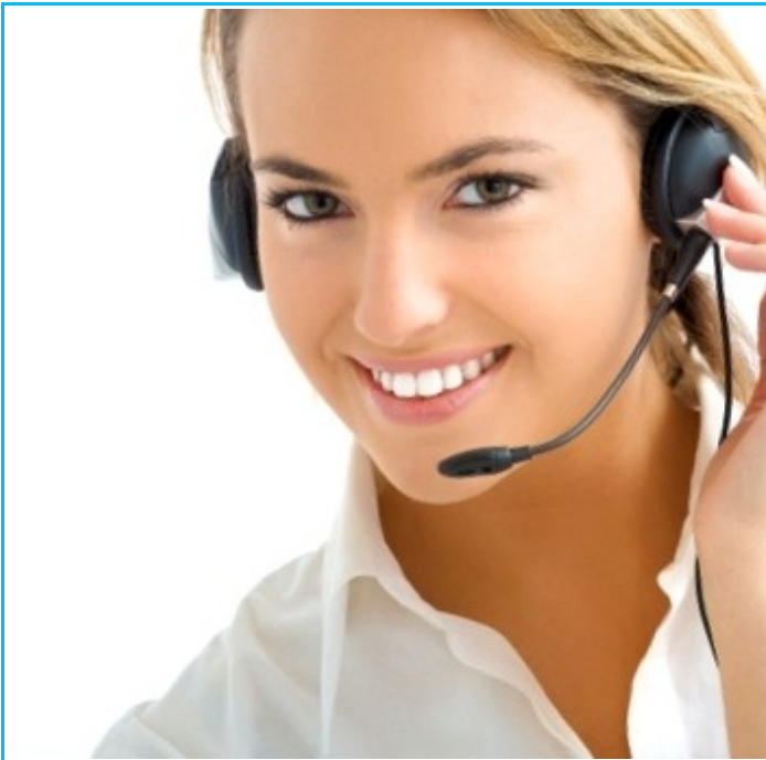
Imagem1- Imagem exemplificativa