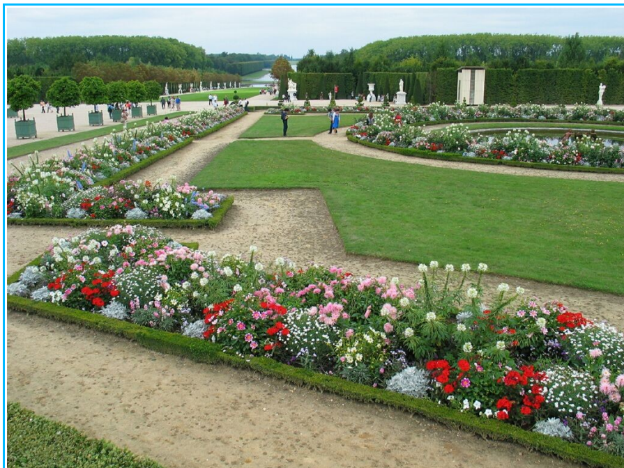
Imagem1- Jardim em França