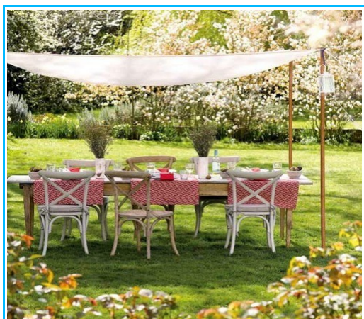
Imagem2- Espaço de refeições familiares

Podem servir ainda para a colheita de flores para decoração e colheita de ervas e vegetais para alimentação.