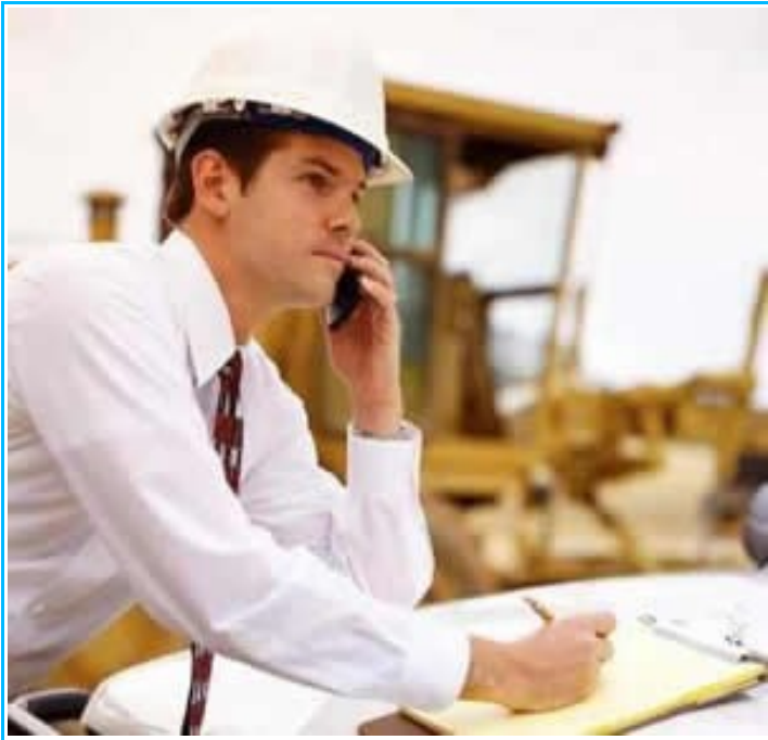
Imagem3- Profissional de arquitetura