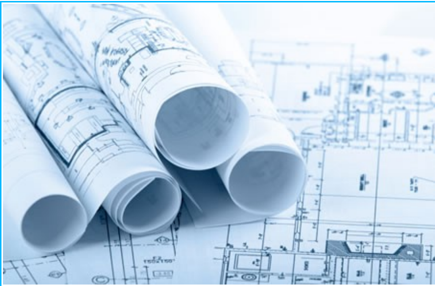
Imagem1- Projetos de arquitetura