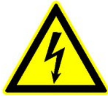
Perigo de electrocussão

Como já aflorámos anteriormente, existem vários tipos de medidas a tomar de forma a utilizar-se uma eficaz política de protecção e segurança contra os riscos eléctricos.