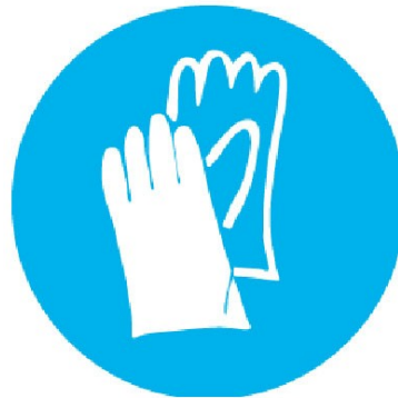
Protecção obrigatória das mãos

Se se quiser actuar contra a possibilidade de contactos directos, as medidas de protecção activas são as mais adequadas. Por exemplo::